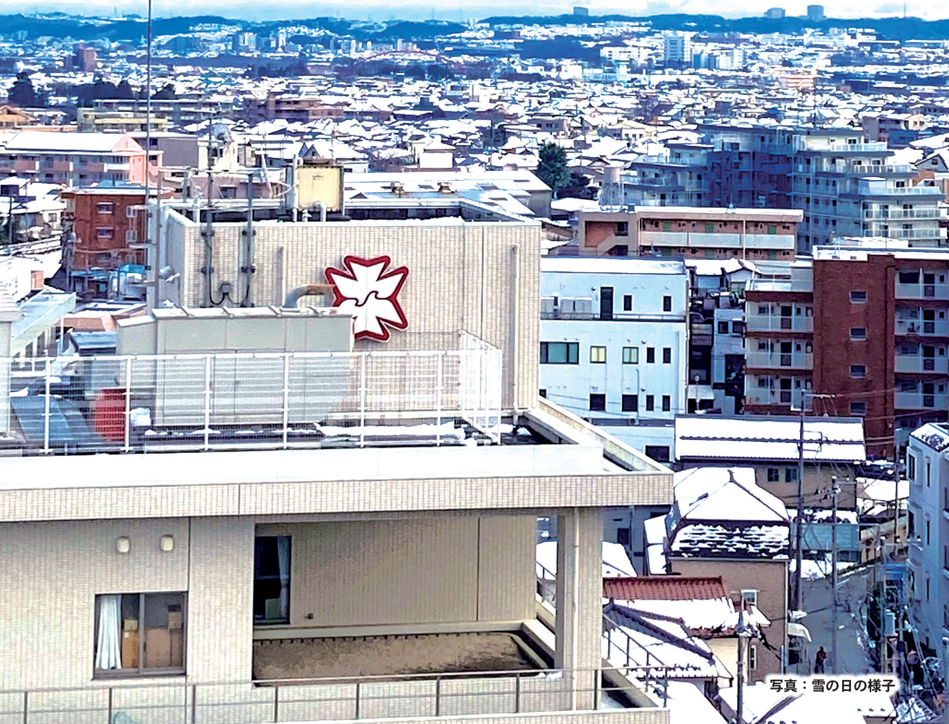
写真：雪の日の様子