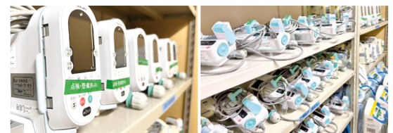
医療機器管理倉庫