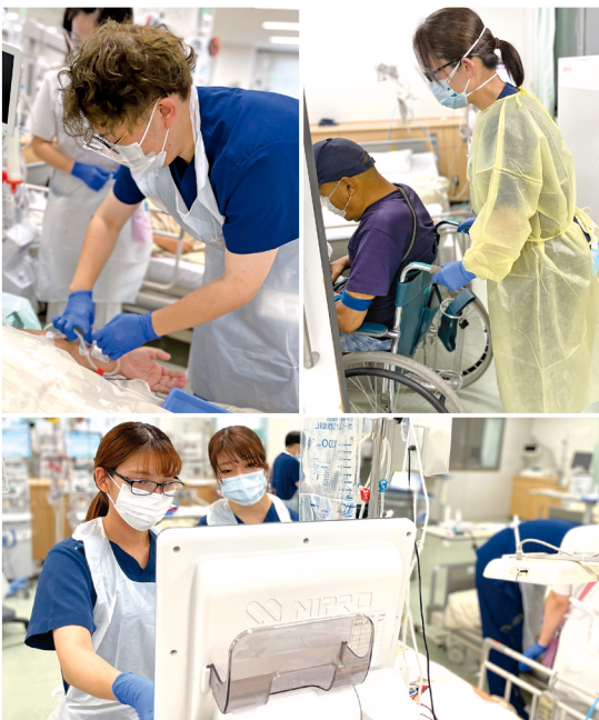
血液浄化業務の様子

我々の業務の中では最も患者さんの前に出ることが多い部署で、医師・看護師を中心とした血液浄化療法にチームで取り組んでいます。