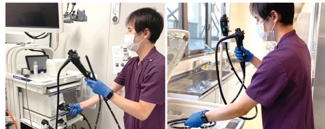
内視鏡室業務の様子

主に胃カメラや大腸カメラ、ERCP（内視鏡的逆行性膵胆管造影法）などの検査や治療が円滑に進むよう医師の直接介助を行っています。また、機器や処置具の操作、保守管理にも携わっています。医師・看護師と共にチームとして緊急の検査や治療にも対応しています。