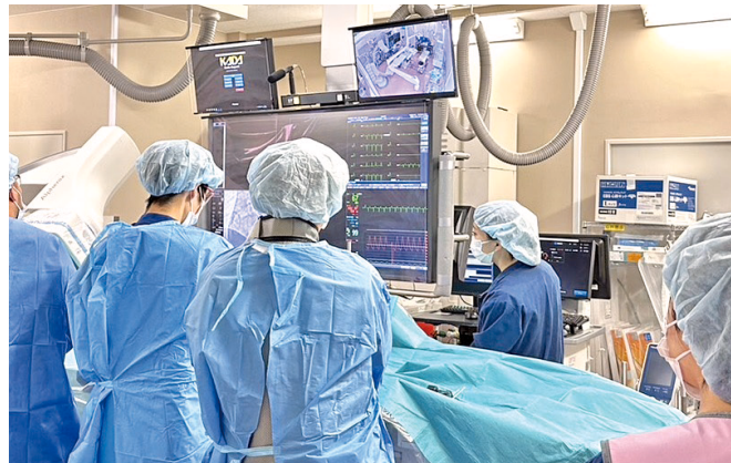
心臓カテーテル室業務の様子