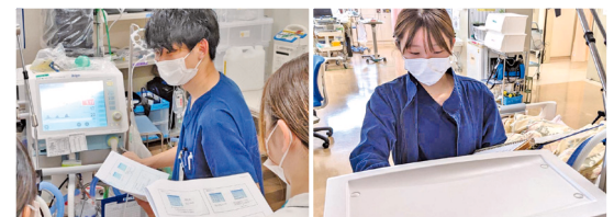
人工呼吸器業務の様子

医療法に則った医療機器の安全管理を継続していくために様々な研修の実施や点検計画に基づく確実な保守点検なども最大限努めています。