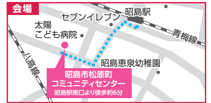
昭島市松原町コミュニティセンター 2階 集会室 昭島市松原町1-3-10