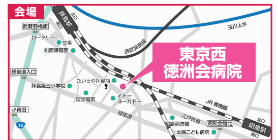
東京西徳洲会病院 042-500-4433 昭島市松原町3-1-1

会場での講座(院内で開催する糖尿病教室を含む)の際は、 マスクの着用 、入場時の手指衛生、体温測定にご理解・ご協力のほど、宜しくお願い致します。また、体調が優れない方のご参加はご遠慮ください。今後の情勢次第では中止になる場合もございます。ご了承ください。