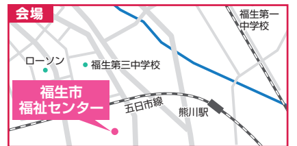
福生市福祉センター 地下研修室 福生市南田園2-13-10

糖尿病教室は感染対策のため、 事前申込制 とさせていただきます。参加希望の方は平日9-17時の間にお電話をいただくか、オンライン健康講座と同様にお問い合わせメールにて前日17時までにお申込みをお願いします。また当日は 1階の受付(医事課)まで 、お声かけください。