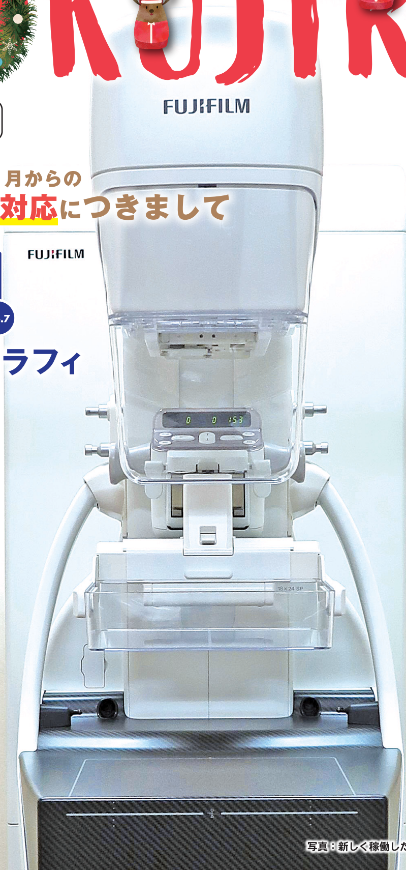
写真：新しく稼働したマンモグラフィ検査装置