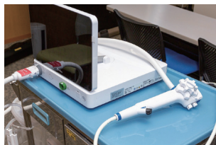
aScope ガストロとディスプレイ